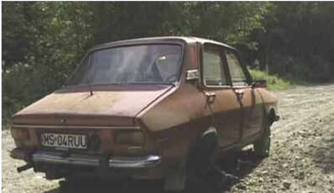
Localnicii își țin mașinile mai mult pe butuci

precizează că au luat în calcul reabilitarea capitală a șoselei județene, dar așteaptă fonduri. „Sper de la anul să obținem ceva fonduri externe pentru reabili-