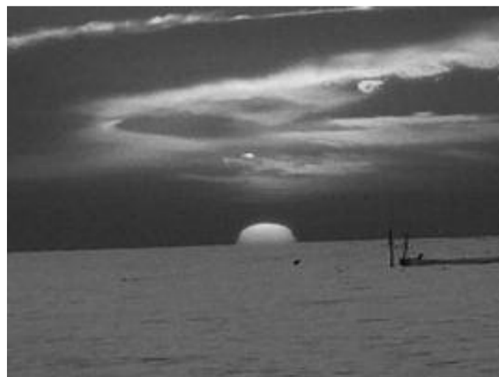
Foc și apă - Luc Pop