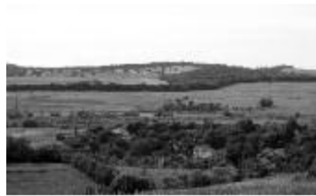
Pe drumul sării la Călugăreni