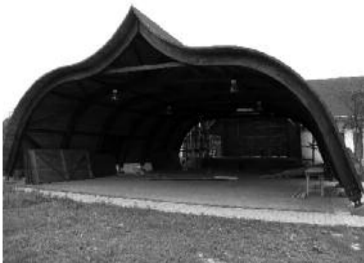
Teatrul din Șura