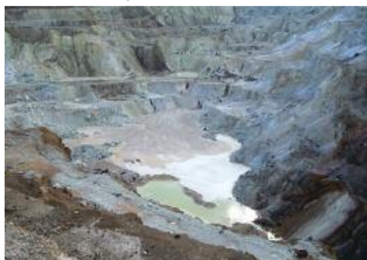
Cariera de sulf