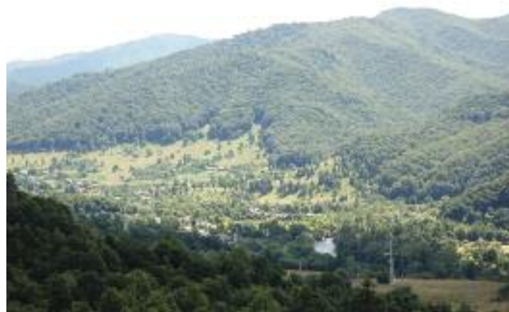
Deda Bistra - Valea Mureșului