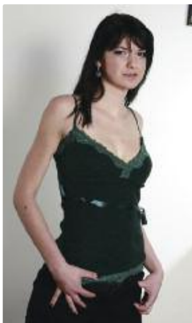
Pagina realizată de Anamaria Viola

CSU Medicina a găsit o cale să promoveze valorile voleiului mureșean. Nu doar prin nivelul performanțelor, ci și prin ... frumusețea voleibalistelor care obțin aceste performanțe. Astfel că elevele tehnicianului Luka Valerijan au pozat pentru un calendar, într-o altă manieră de cum sunt obișnuiți spectatorii veniți să le susțină săptămână de săptămână la Sala Sporturilor "Anton Pongraz" din Tîrgu Mureș.