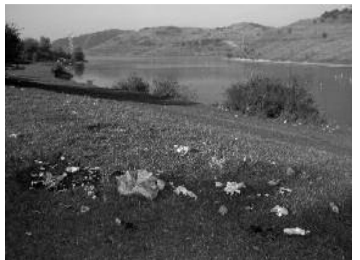
După 1 mai