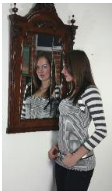
Pagina realizată de Anamaria Viola

mureșene a găsit o a doua familie, ceea ce o face să își dorească să evolueze și în anii următori alături de CSU Medicina. Pentru că a dorit să ajute la promovarea echipei, a pozat alături de coechipierele sale în calendar, însă nu consideră că ar avea valențe de fotomodel. Nu ar poza însă niciodată nud, în nici o circumstanță. Consideră că cele mai importante lucruri în viață sunt familia, cariera și prietenul. Asta dacă l-ar avea. Tot ce își dorește în acest moment este sănătate, să își poată continua cariera voleibalică, iar la anul să ajungă alături de CSU Medicina pe locul 1 sau 2 în campionat.