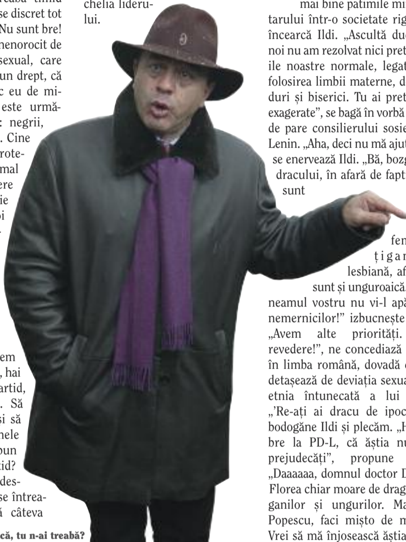
Păsărică, tu n-ai treabă?

secunde vine cu ideea să mergem la UDMR, că ei sunt cu protecția minorităților. Auzim noi că e Marko Bela în zonă, așa că țuști la cabinetul lui prezidențial de pe strada Ulciorului. Acolo, nici vorbă să putem vedea chelia liderului.