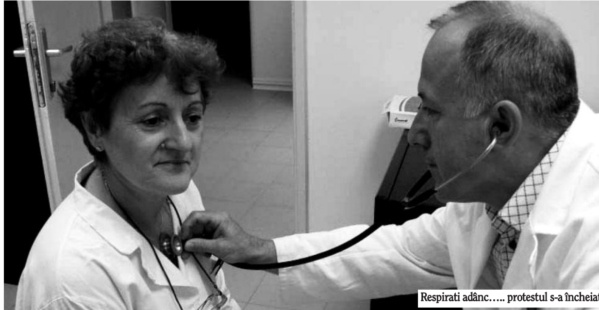
Respirati adânc..... protestul s-a încheiat

Cabinetele medicale au fost aproape goale astăzi. Și asta pentru că bolnavii s-au reprogramat, convingși de faptul că medicii lor de familie vor fi în concediu de odihnă de astăzi și până