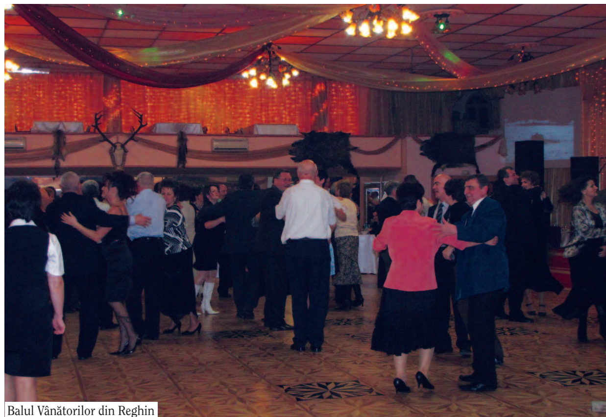
Balul Vânătorilor din Reghin

Mulți dintre noi nu suntem de acord cu vânătoarea și gândim că dacă am putea am face ceva să învățăm să iubim tot ceea ce ne înconjoară. Că vânătoarea este o lipsă totală de fair play. Că nici un vânător nu ar putea să ucidă măcar o vulpe cu mâinile goale.