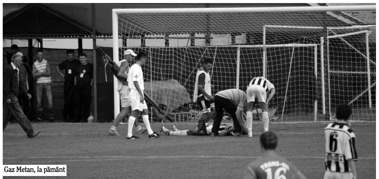
Gaz Metan, la pământ

Gaz Metan Tîrgu Mureș, echipă de liga a III-a, a ajuns în situația paradoxală de a-și pregăti meciurile în condiții mai proaste decât o formație din divizia sătească. Primăria Corunca le-a pus la dispoziția jucăto-