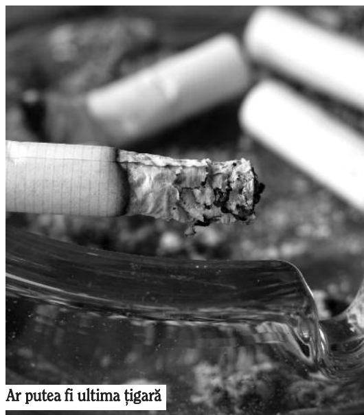
Ar putea fi ultima țigară

Guma de mestecat, plasturele, picăturile sau tabletele sunt produsele care au invadat rafturile farmaciilor și care promit renunțarea la fumat. Specialiștii spun însă că nu trebuie să ne lăsăm păcăliți de aceste produse, întrucât nu este așa de ușor de ieșit din capcana fumatului.