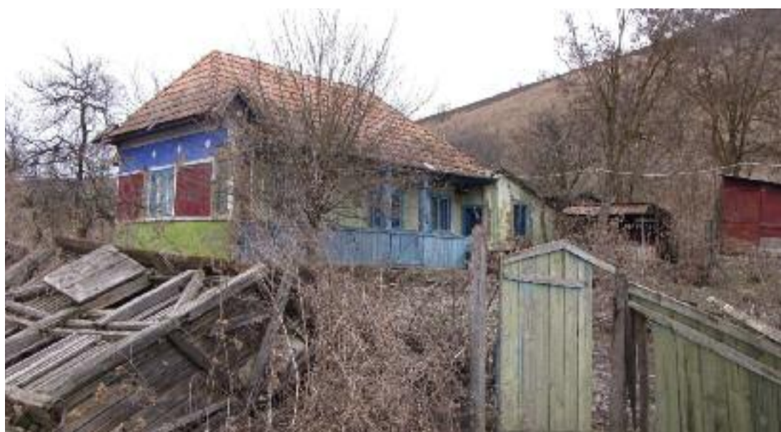
O vreme, una din case a fost locuită de oameni cărora le plăcea să o vadă curată. An de an îi dădeau o nouă culoare și îi trasau cu rolul modele noi. Pentru că o iubeau.

Și chiar și drumurile duc încet, iremediabil înspre nicăieri.