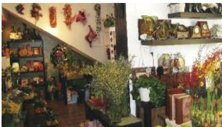
Florile cresc în cești, savoniere ori cutii de tablă pictate, rareori în ghivece sau vase obișnuite.

Despre Gyongy nu e foarte mult de spus, vorbesc despre ea minunile pe care le-a adunat în „căsuța cu povești”. Am întrebat-o cum le alege și răspunsul a venit simplu, pe negândite: „Nu am nimic în magazin din ceea ce nu aș pune în casa mea”. Un răspuns care spune totul.