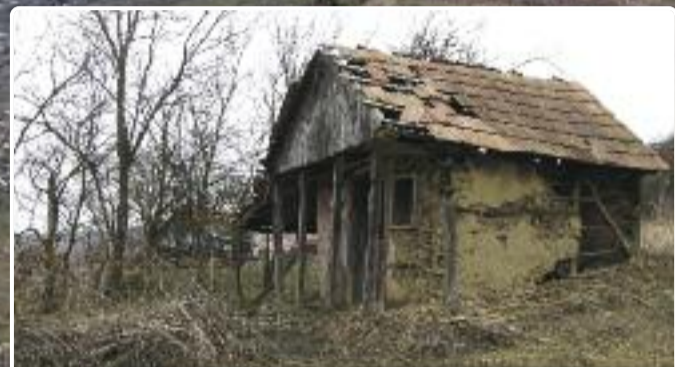
Alte case nu știu ce s-a întâmplat. S-au trezit așa, goale, într-o dimineață. Și de atunci așa-și duc zilele.