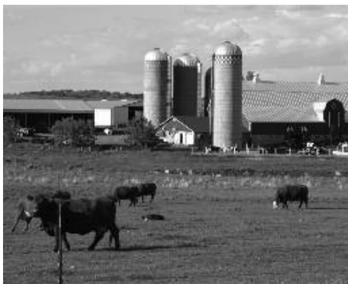
Undeva, în Europa. Poate, în curând, și în România.

Beneficiarii eligibili sunt fermierii în vârstă de până la 40 de ani (neîmpliniți la data depunerii cererii) care practică activități agricole iar exploatațiile agricole au dimensiunea economică cuprinsă între 6 și 40 UDE, sunt situate pe teritoriul țării și sunt înregistrate la Re-