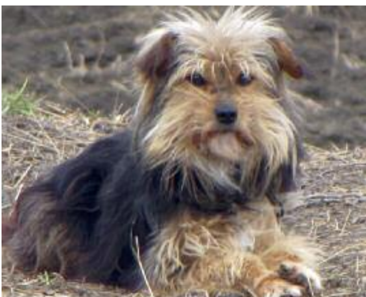
Doar lătratul plictisit al vreunui câine și ciripitul păsărilor mai sparge surzenia locului.

Am trecut pe lângă fostul sat fără să-l vedem. Ne-am întors îndrumați de localnicii din Cecălaca. Acest loc în care trecerii timpului i-au rezistat doar pivnițele trainic făcute se numea Ozdeni. Un cătun în care își duceau traiul 14 familii. De zeci de ani, însă, printre aceste vestigii, mărturiile existenței trecătoare a oamenilor, cărare bătută și-au