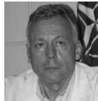
Borbély László Senat.

Luni, în ședință comună, cele două Camere ale Parlamentului României au votat componența delegațiilor parlamentare la organismele internaționale. Deputatul Borbély László, președintele Comisiei pentru politică externă, a fost validat ca președinte al Delegației Parlamentului României la Inițiativa Central Europeană – dimensiunea parlamentară. Anul 2009, când Inițiativa Central Europeană aniversază 20 de ani de existență, este anul în care România exercită Președinția-in-Exercițiu (PIE) a ICE, mandat pe care-l deține pentru prima dată de la dobândirea statutului de membru al Inițiativei, în 1996. Pe dimensiunea parlamentară, pentru acest an sunt prevăzute două reuniuni, și anume: Reuniunea Comitetului Parlamentar ICE (7-9 mai 2009), organizarea fiind asigurată de Camera Deputaților și Adunarea Parlamentară ICE – noiembrie 2009, organizarea fiind asigurată de