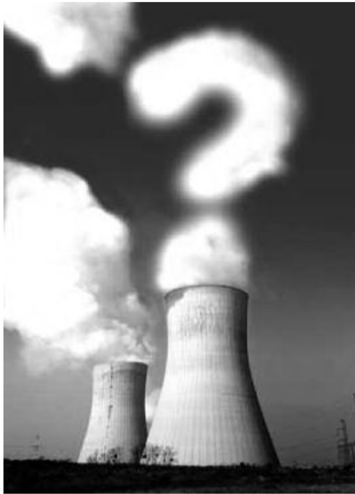
Salariații cunosc situația și sunt îngrijorați, nefiind excluse mișcări sociale.

“Singura decizie ce poate fi luată este de oprire a activității societății, decizie cu consecințe extrem de grave atât în plan imediat cât și pe termen lung și care va afecta toate categoriile de personal”, afirmă conducerea Azomureș. În continuare se arată că salariații cunosc situația și sunt îngrijorați, nefiind excluse mișcări sociale. “Mișcările sociale care se preconizează a se organiza de către reprezentanții producătorilor agricoli care își văd munca irosită, vor fi susținute de salariații din unitățile producătoare de îngrășăminte, deoarece interesele noastre sunt comune și cu toții