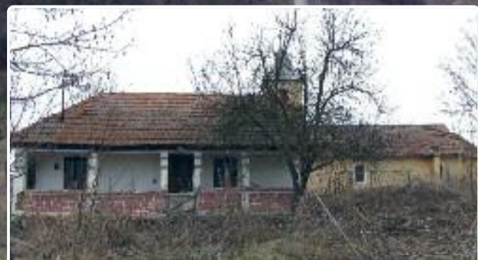
Clopotul bisericii mai răsună doar la sărbătorile mari, dar și atunci cu întârziere de câteva zile.