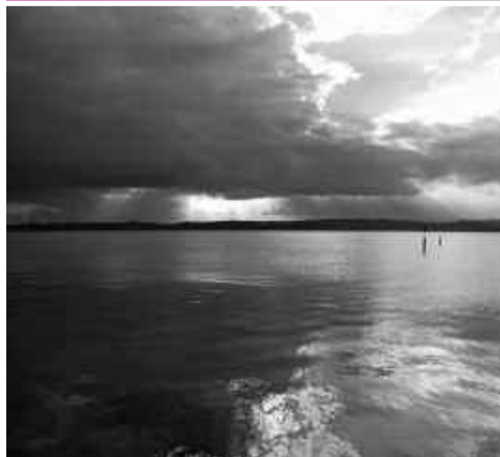
Lacul Garda din orașul Sirmione - PCSABI