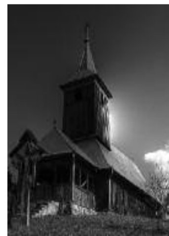
Biserica de lemn din Urisiu

În județul Mureș există peste 1000 de monumente istorice clasificate