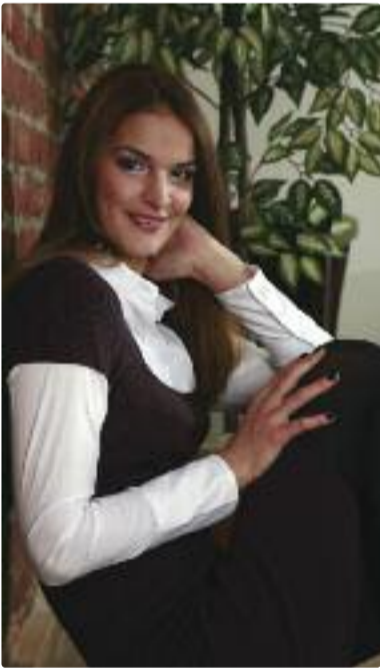
Pagina realizată de Anamaria Viola

CSU Medicina a găsit o cale să promoveze valorile voleiului mureșean. Nu doar prin nivelul performanțelor, ci și prin ... frumusețea voleibalistelor care obțin aceste performanțe. Astfel că elevele tehnicianului Luka Valerijan au pozat pentru un calendar, într-o altă manieră de cum sunt obișnuite spectatorii veniți să le susțină săptămână de săptămână la Sala Sporturilor „Anton Pongraz” din Tîrgu Mureș.