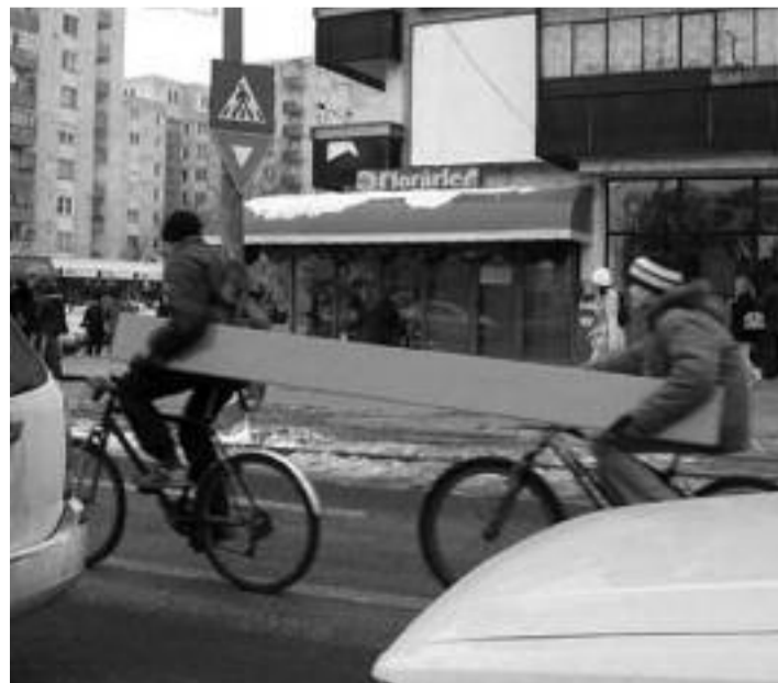
Regii logisticii