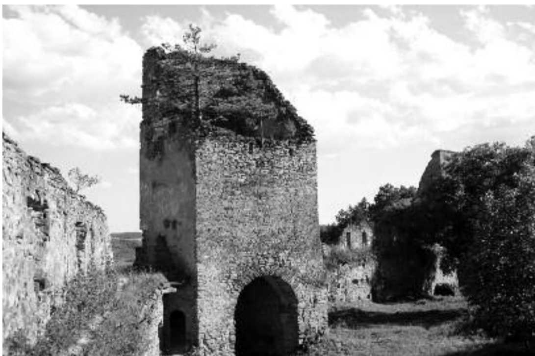
Cetatea Urișilor din Saschiz

Fenomenul nu este singular, îl putem întâlni în tot județul, îmbrăcând aspecte infracționale și contravenționale. Deși s-au întocmit dosare de cercetare penală privind infracțiuni în legătură cu patrimoniul cultural imobil, finalizarea cercetărilor este uneori întârziată datorită insuficienței și ambiguității mijloacelor de coerciție legală și, de ce să nu o spunem, lipsei de comunicare eficientă și operativă cu alte instituții abilitate: Inspectoratul de Stat în Construcții,