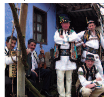
Un bob zăbavă, între două jocuri