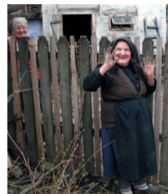
La porți, priviri curioase