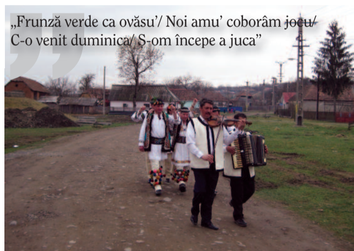
„Frunză verde ca ovăsu'/ Noi amu' coborâm jocu/ C-o venit duminica/ Și-om începe a juca”