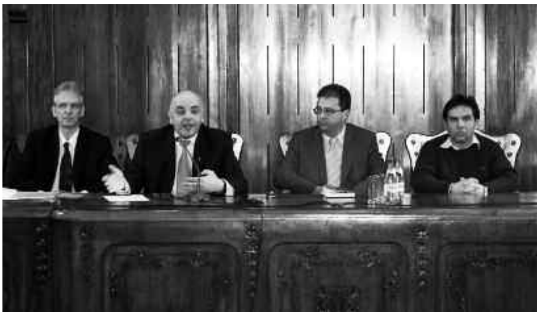
Până în 15 martie primele centre vor fi funcționale

atunci când nu sunt foarte multe cazuri”, a spus Arafat. Legat de faptul că datele bolnavilor sunt monitorizate de STS, ceea ce ar putea declanșa o nouă isterie privind supravegherea, subsecretarul de stat a spus că nu sunt motive de îngrijorare. „Trebuie să înțelegă lumea că peste tot, și în Croația, unde am fost recent, exact agenția omoloagă STS se ocupă de asta. Pentru mine, ca ministru, este mult mai simplu să colaborez cu ei. O eventuală isterie nu ar avea nicio justificare. Noi vorbim de date medicale și nu cred că cineva ar fi interesat să facă o colecție de electrocardiograme. Nu cred că pe cei de la STS ar putea fi interesați de asta”, a precizat Raed Arafat.