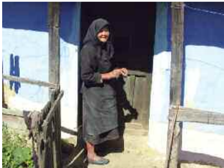
Cei șase copii pe care i-a crescut, au uitat-o

„LA MULȚI ANI”, multă sănătate și un suflet mereu tânăr le dorește tuturor femeilor și în special mureșencelor primăria comunei Petelea.