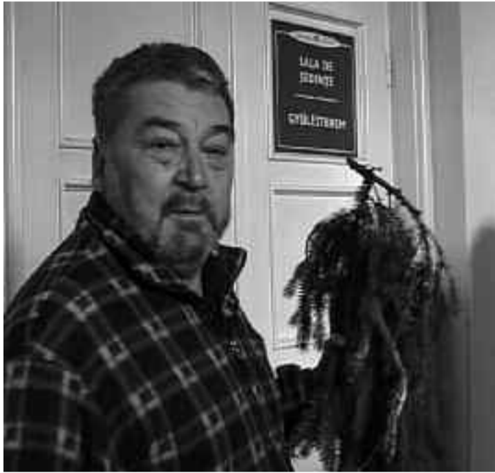
Oamenii plantează, Primăria retează

Dacă la alte dezbateri publice organizate de Primăria Tîrgu Mureș participarea cetățenilor a fost ne semnificativă, marți târgumureșenii nemulțumiți au luat cu asalt sediul autorității locale. Nemulțumirile cetățenilor au fost multe. Unii au reclamat că în timp ce în unele locuri arborii sunt tăiați fără sens, în alte locuri copacii care reprezintă un pericol pentru viața oamenilor sunt lăsați în