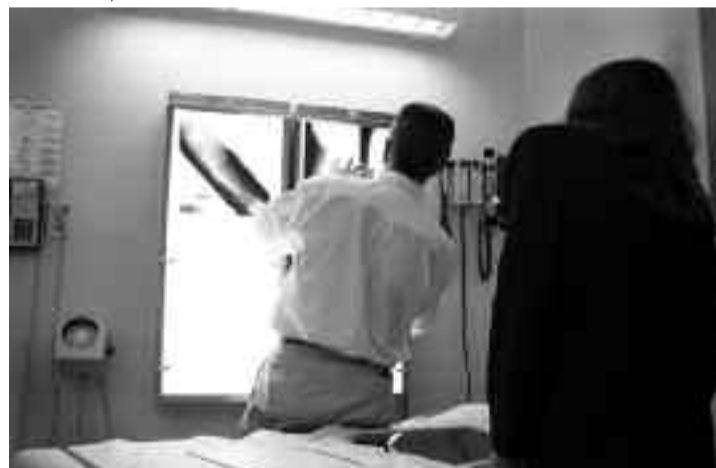
Medicii din spitalele mici vor beneficia de sfaturile specialiștilor din Tîrgu Mureș, după ce aceștia văd pacientul și analizele care i se fac prin sistem audio-video

Inițiatorul SMURD a mai spus că a fost ales Tîrgu Mureș ca centru pilot deoarece „are experiență pe telemedicină din 2003, între mașinile de urgență și UPU funcționează acest sistem”. UPU a Spitalului Județean de Urgență Mureș este conectată la acest sistem de telemedicină cu 33 de spitale municipale și orașenești din Regiunea 7 Centru și cu un număr de ambulanțe, momentan