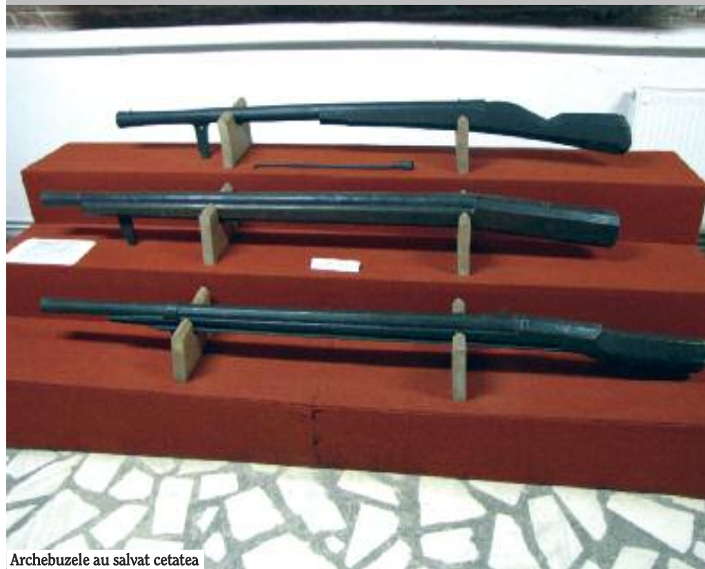
Archebuzele au salvat cetatea