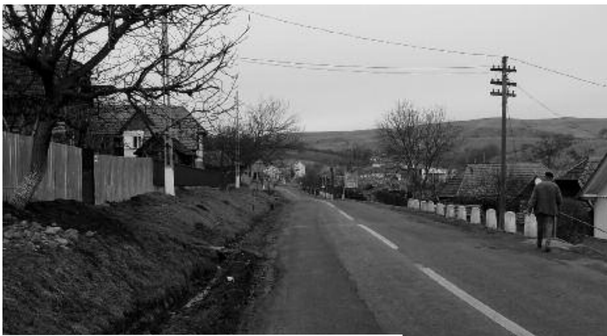
...și cel mai lung drum începe cu primul pas

În Fărăgău și Tonciu există două școli funcționale, în care învață 184 de elevi, iar grădinițe sunt în Fărăgău, Tonciu și Poarta. Școala din Fărăgău are nevoie de încălzire centrală, grupuri sanitare, extindere și reabilitare. Elevii din localitatea Tonciu, precum și cei din Poarta, sunt aduși la cursurile în limba română la școala din centrul de comună cu ajutorul unui microbuz școlar, primit de administrația locală în anul 2007. În plus, alți șapte elevi din Lefaia frecventează școala din Fărăgău. Aceasta, dar și cea din Tonciu, beneficiază de laborator de informatică, cu conexiune la internet. În ultimii patru ani, potrivit unei statistici locale, numărul elevilor a fost în ușoară creștere, iar rata abandonului școlar a fost zero. Cămine culturale sunt patru, câte unul în fiecare sat, însă unele dintre