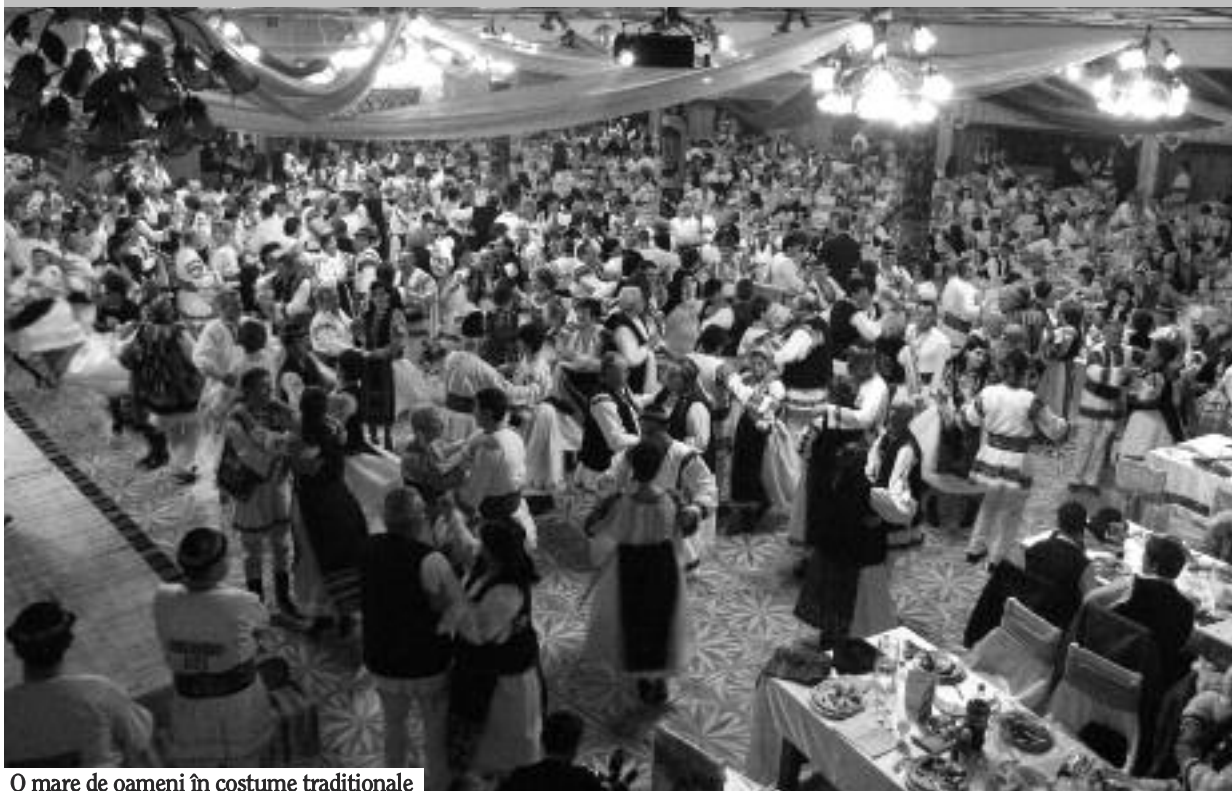
O mare de oameni în costume tradiționale