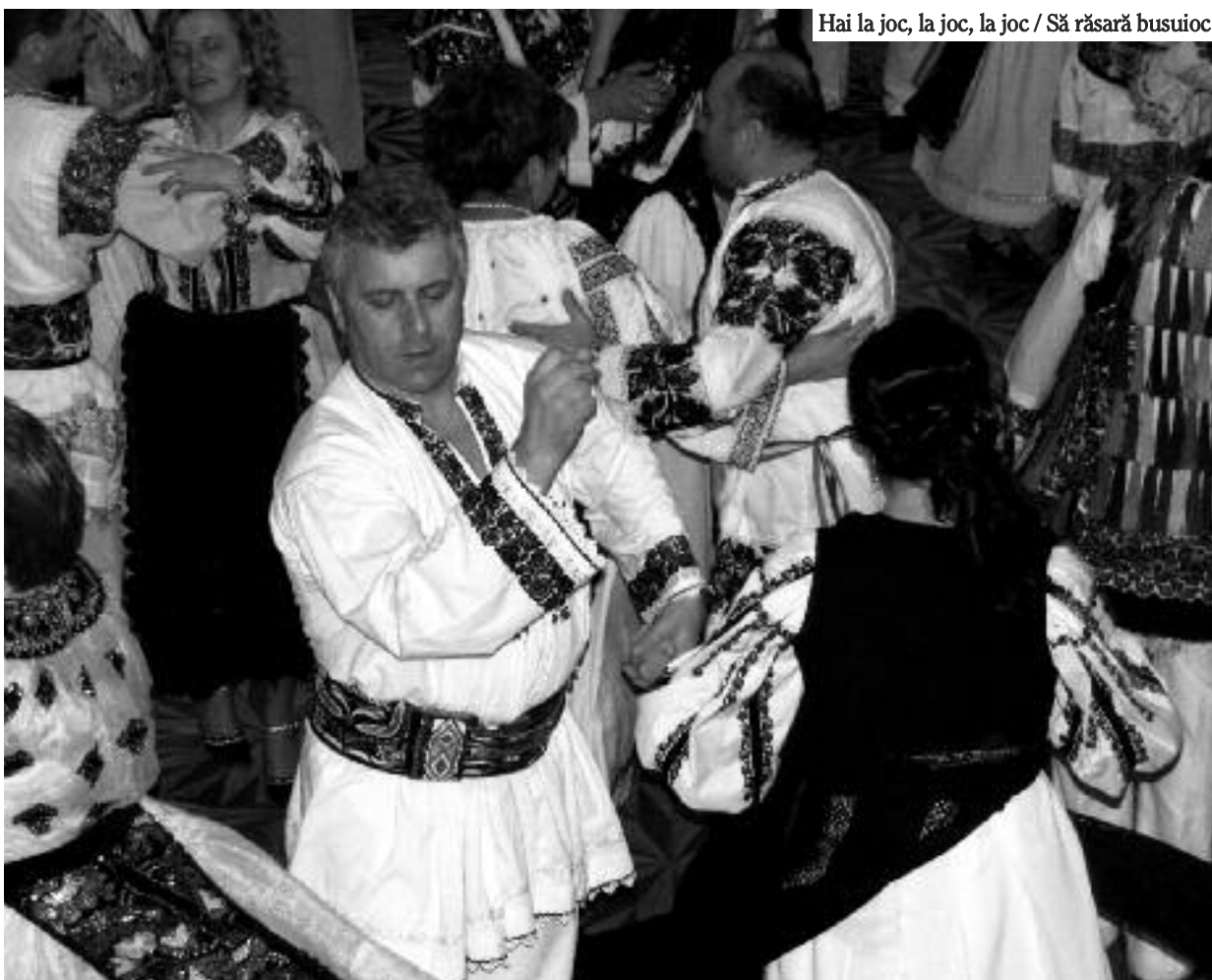
Hai la joc, la joc, la joc / Să răsară busuioc