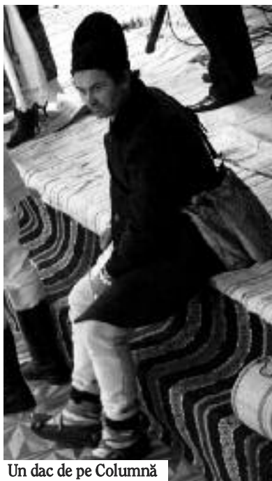
Un dac de pe Columnă