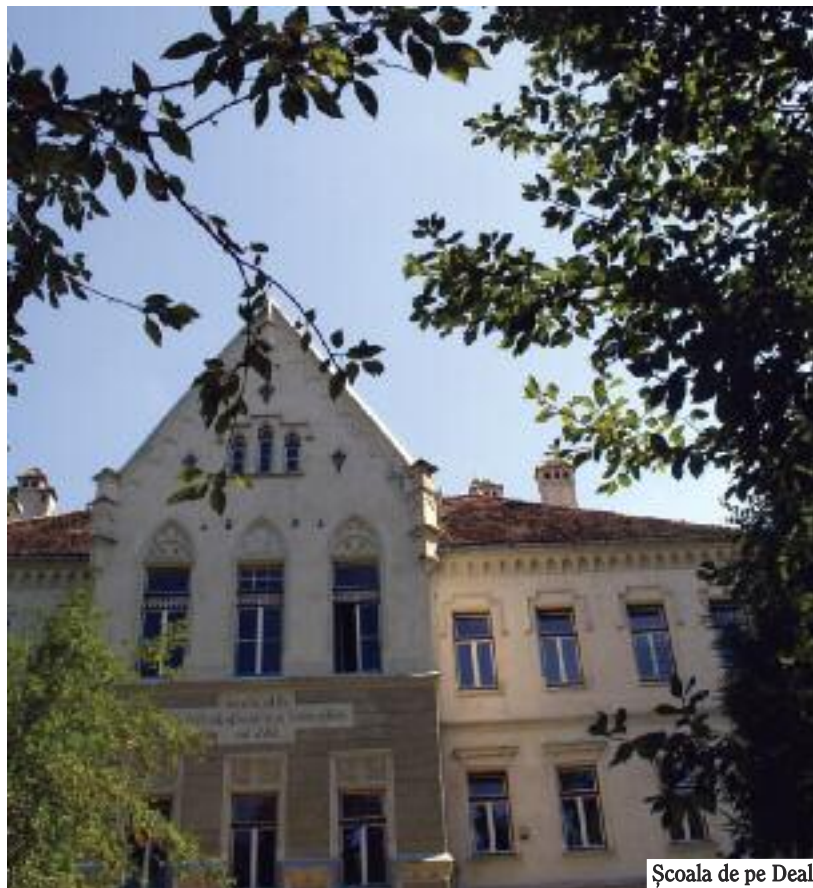
Școala de pe Deal