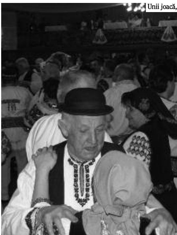
Unii joacă, ceilalți învață