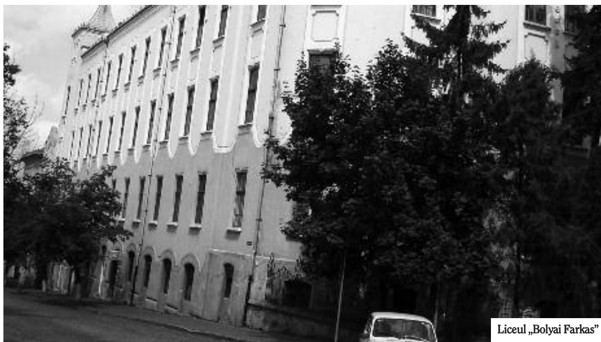
Liceul „Bolyai Farkas”

Liceul „Bolyai Farkas” a fost retrocedat Eparhiei Reformate din Cluj Napoca, iar Colegiul Național Unirea a fost revendicat de Episcopia Romano-Catolică din Alba Iulia. Cele două imobile sunt în paragină și pun în pericol viața copiilor care învață acolo, susține Dorin Florea, primarul municipiului Tîrgu Mureș. „Mă îngrijorează. Liceul Bolyai, ca și Colegiul Unirea sunt două colegii importante, și pentru maghiari reprezintă unul din marile lucruri de apreciere și de respect, dar eu nu pot să nu constat că ceea ce se întâmplă acolo este de neacceptat în sensul administrării, în sensul gospodăririi lor. Deci, biserica nu are bani, iar liceul (n.r. Bolyai) este într-un foarte mare pericol. Una, că arată prăfuit, dar este pur și simplu periculos. Instalațiile de încălzire pot pune viața copiilor în pericol. Sala festivă, acoperișul, sistemul de infrastructură... Sunt mari, mari probleme. Nu s-a ținut cont, din păcate, când am atras atenția la început ca aceste instituții să nu se predea, ci să rămână ale autorităților locale, pentru că autoritățile locale aveau posibilitatea și să investească și să susțină proiecte ale ministerelor dar biserica nu poate intra în această situație. Biserica trebuie să ia o decizie foarte fermă pentru că din banii de chirie aproape că îți trebuiesc 20 de ani să o pui la punct”, a declarat