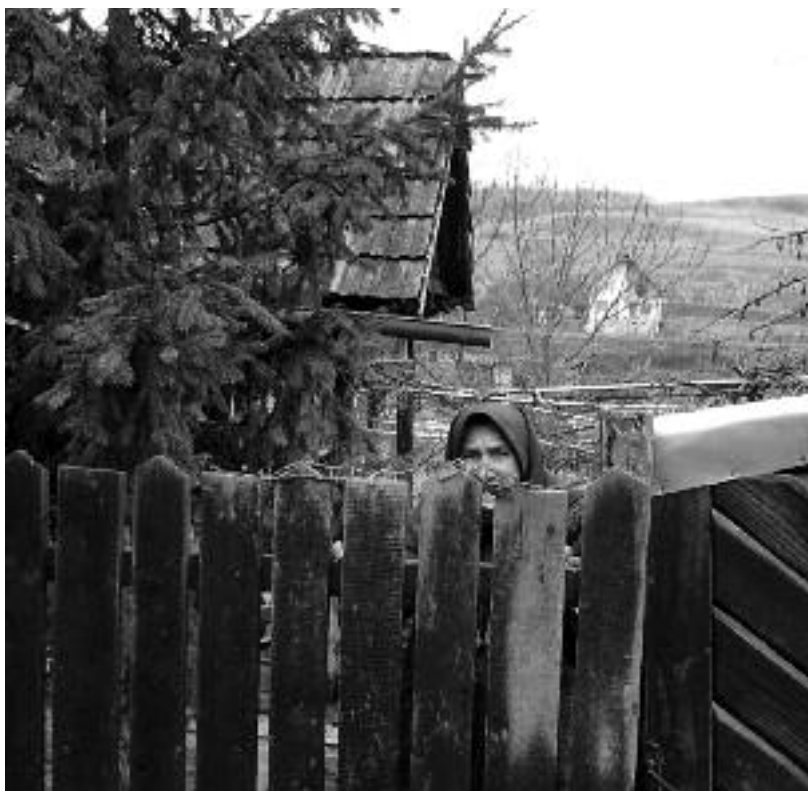
Bătrânii își așteaptă copiii plecați să-și caute norocul la oraș

acestea au nevoie de reabilitare și dotare suplimentară. Căminul cultural din Fărăgău a beneficiat în ultima vreme de reabilitări, însă mai are nevoie și de mobilier suplimentar. La căminul cultural din Tonciu s-au schimbat ușile și geamurile. În sala Căminului Cultural își desfășoară repetițiile Ansamblul de dansuri populare "Floriciă de pe Tău".