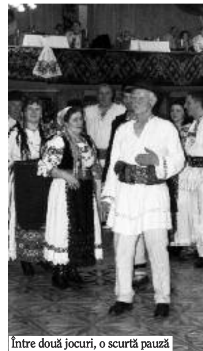
Între două jocuri, o scurtă pauză