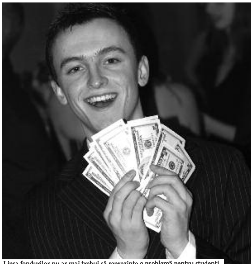
Lipsa fondurilor nu ar mai trebui să reprezinte o problemă pentru studenți

În funcție de proiectele pe care le ai, ca student poți împrumuta între 200 și 3.500 de euro. Băncile îți oferă variante multiple pentru a-ți plăti manualele de studiu de care ai nevoie, pentru a-ți achiziționa un calculator sau chiar pentru a studia în străinătate, în cazul în care bursa obținută pentru studii nu îți este suficientă. Nici în ceea ce privește condițiile de creditare, bancherii nu sunt foarte selectivi. Pentru un astfel de credit trebuie doar să prezinți dovada că ești