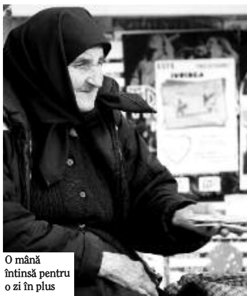
O mână întinsă pentru o zi în plus

Se spune că motorul economiei sunt creditele. Acest slogan pare meschin atunci când vine vorba de împrumuturile la care mulți dintre pensionarii mureșeni apelează nu pentru a face o investiție, nu pentru a-și oferi, după o viață de muncă, un binemeritat sejur prin cine știe ce loc exotic, așa cum fac vârstnicii din lumea civilizată, ci pur și simplu pentru a supraviețui. Soluția unei zile în plus, a încă unei pastile de medicament și a unei pâini pe masă este un împrumut de la Casa de Ajutor Reciproc a Pensionarilor.