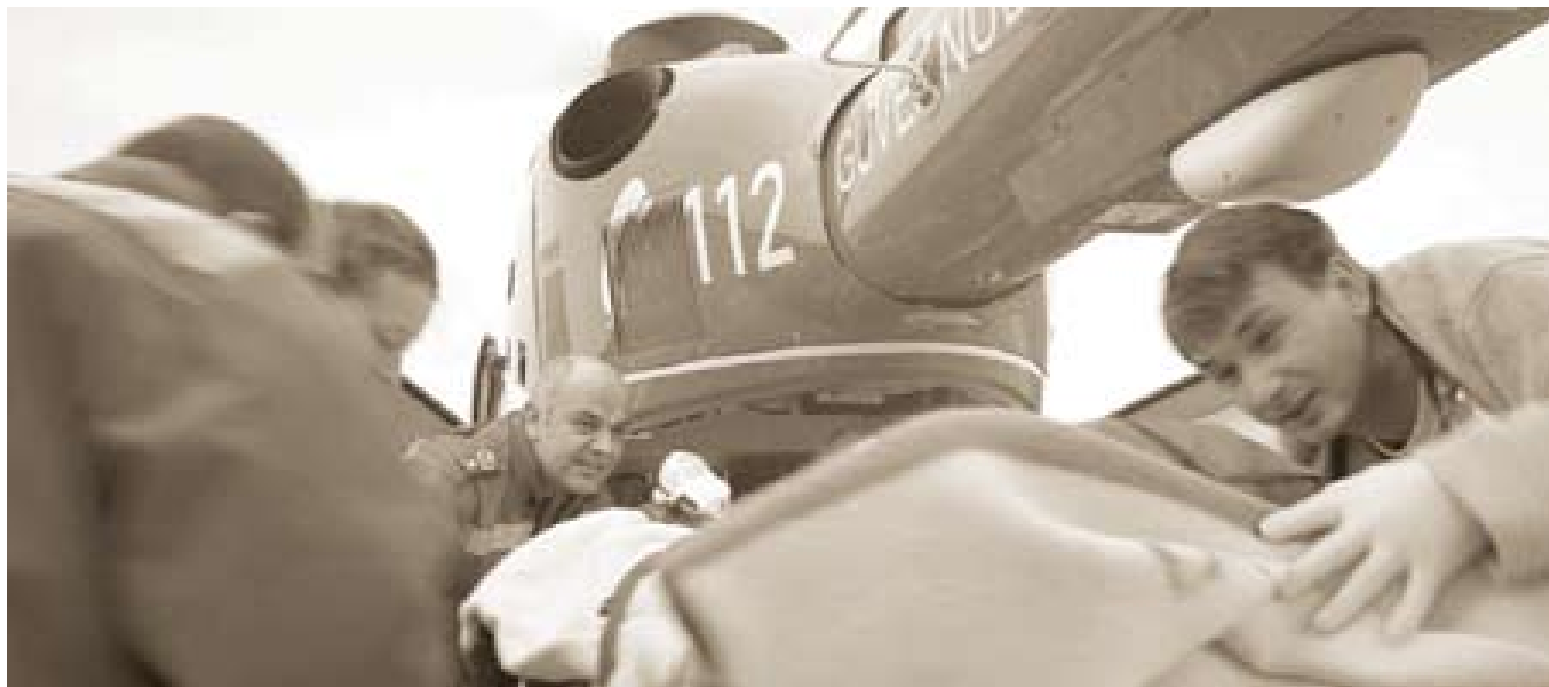
Raed Arafat nu a încercat niciodată să își asume succesul, mereu l-a atribuit echipei și colaborării cu pompierii militari