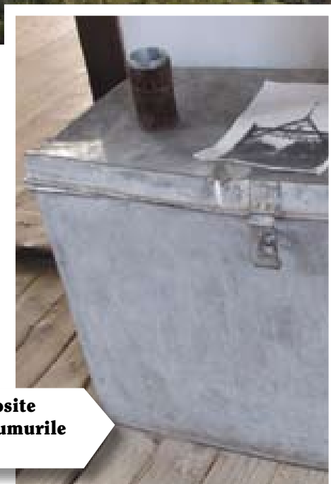
Unul din cuferele de aluminiu folosite de exploratorul Samu Teleki în drumurile sale prin Africa

Ceva îi lega ireversibil de aceste locuri, de aceste dealuri.